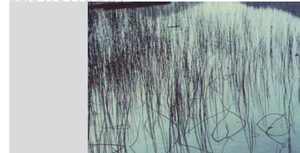
o.T. aus der Serie Treibholz | 2002 | Fotografie auf Aludibond | 40 x 50 cm

Zeichnung, Bezug nehmend auf die schwarzweiß Fotografie, oder Zeichnung entstanden durch Spiegelung im Wasser, sind gewählte Prozesse, die Ähnlichkeit aufweisen.