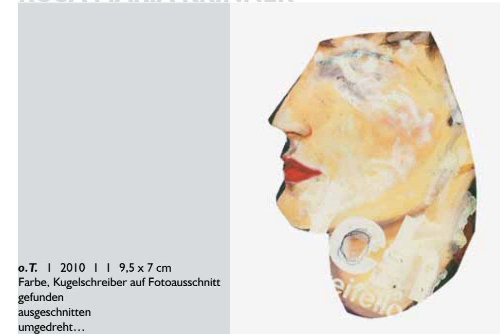
o.T. | 2010 | | 9,5 x 7 cm