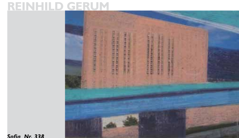
Sofia Nr. 338

2010 | Ölpastell auf Ansichtskarte | 11,1 x 15,8 cm