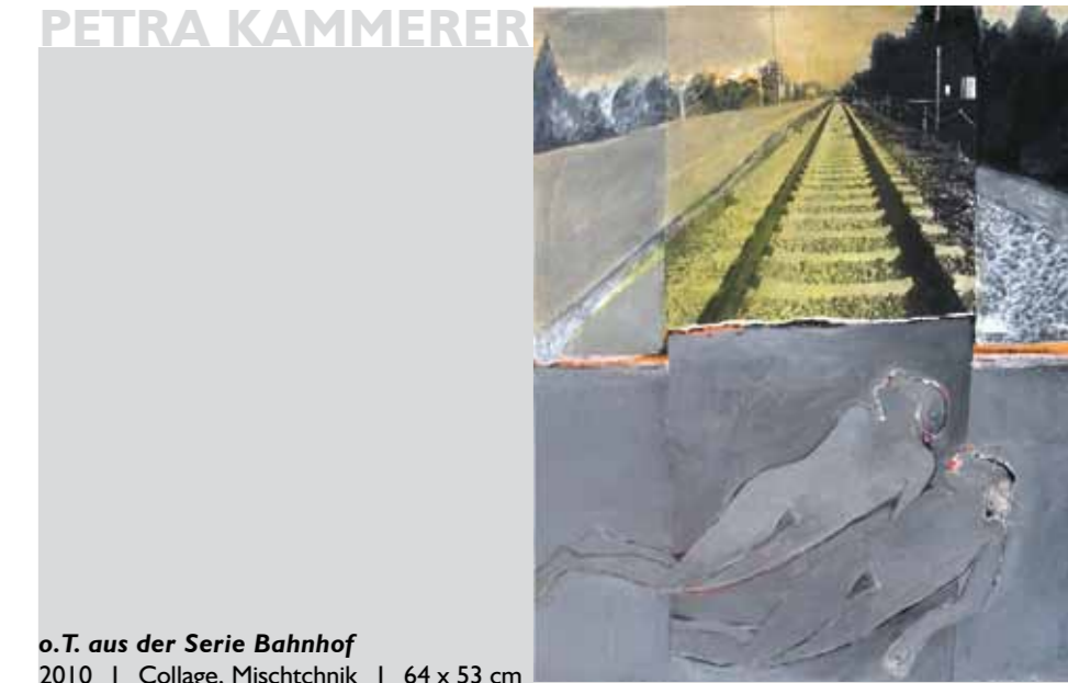
o.T. aus der Serie Bahnhof

2010 | Collage, Mischtechnik | 64 x 53 cm